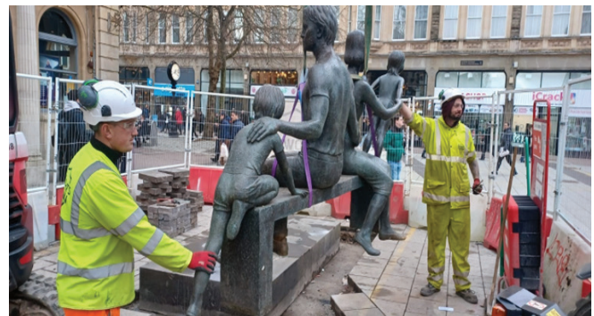
Reinstating the statue in Queen Street