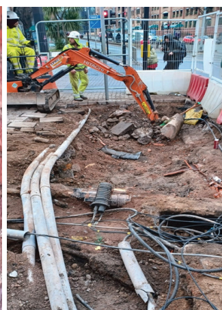
Cloddiaid llwybr beicio yn amlygu ceblau, y tu allan i Sainsburys, Heol y