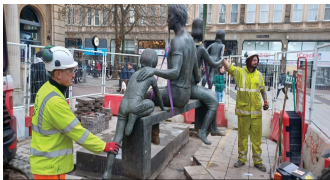
Adfer y cerflun yn Heol y Frenhines