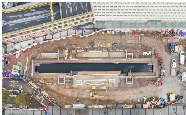
Delwedd drôn diweddaraf o Cwr y Gamlas

Fel rhan o'r cynllun, bydd yn rhaid i ni wneud gwaith nos na ellir ei osgoi, mae rhai o'r gwaith nos hwn wedi'u cynllunio ym mis Mai/Mehefin. Bydd y rhai yr effeithir arnynt gan y gwaith yn derbyn rhagor o wybodaeth ymlaen llaw. I gael rhagor o wybodaeth am ein gwaith nos ac i gael y wybodaeth ddiweddaraf am y cynllun, ewch i: www.KBcanalquarter.co.uk