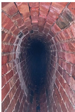
Hen garthffos wyau brics Fictoraidd ar Heol y Frenhines